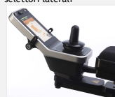
Dettaglio comando touch screen REM400 con selettori laterali